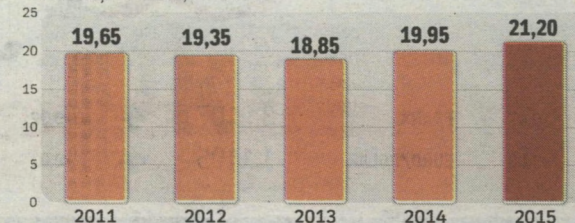
Okna i drzwi Produkcja w Polsce, w mln szt.

Dodaje, że spółka prowadzi produkcję w oparciu o najlepsze na świecie technologie, półprodukty i maszyny, które najczęściej pochodzą... z Niemiec. W efekcie nawet czarny PR, który czasami się zdarza, nie ma obecnie istotnego wpływu na plany Druteksu.